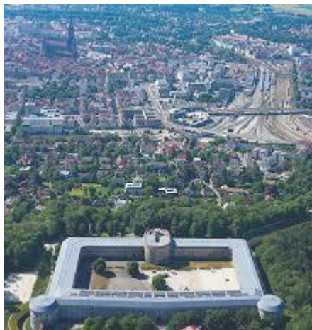
Luftbild Wilhelmsburg